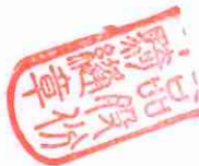
花蓮縣 113 學年度國中小學校午餐委外辦理勞務採購案 7 學校名冊