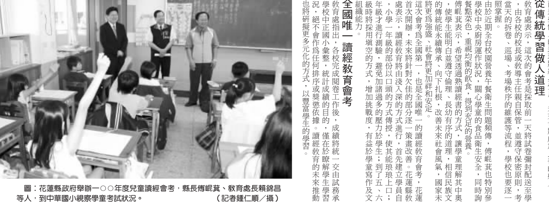
圖：花蓮縣政府舉辦一〇〇年度兒童讀經會考，縣長傅崐萁、教育局長賴錦昌等人，到中華國小視察學童考試狀況。

小學前 熟稔傳統經典 花蓮縣的讀經教育，是縣長傅崐萁就任後推動的六大教育政策之一，從九九年五月一日開始在全縣國小全面推行，希望讀經的小學小朋友，在國小畢業之前能熟讀中國的傳統經典，讓琅琅讀經聲響遍整個校園。 今年度首次辦理會考，除了全縣一百零三所公立小學外，私立海星與慈濟小學也共同參與，共有一萬五千三百三十三名學生參加考試，以筆試為主，是非二十題，配題三十題，各校考場秩序均良好。 傅崐萁在教育局長賴錦昌的陪同下，昨天上午到中華國小巡視，以瞭解學校考試情形，並勉勵學童要孝順父母、尊敬師長，而這些做人的道理將終身受用，未來也將成為良善的好人。 從傳統學習做人道理 教育處表示，這次的會考是採取前一天將試卷密封送至學校，由各校的校長或教導主任親自保管，並遵守保密原則，考試當天的拆卷、巡場、考場秩序的維護等流程，學校也要逐一拍照掌握。 由於近期全台灣校園營養午餐衛生問題頻傳，傅崐萁也特別參觀學校中央廚房運作狀況，關心學童的食品衛生安全，同時詢問餐點菜色，希望透過讀經書的方式，讓學童理解其中奧義，使學童能明白並遵守倫理、長幼有序的道理，相信民族文化的傳統能永續傳承，向下扎根，改善未來社會風氣，國家未來將更為強盛、社會將更加祥和安定。 這次會考為全國第一，也是全國唯一的讀經教育會考，花蓮縣首次開辦，未來將針對欠佳的部份逐一策畫改善。花蓮縣教育處表示，讀經教育將由淺入深的方式進行，首先建立學員自信，小學一年級的部份以口誦的方式傳授，使其能琅琅上口；三年級才進行測驗，避免加諸過多的壓力於學生；到了五、六年級時將採用填寫的方式，增加挑戰度，有益於學童寫作及文字組織能力。 全國唯一 讀經教育會考 教育處指出，各校完成閱卷工作後，成績將統一交由試務承辦學校中正國小彙整，統計成績的目的，僅在於瞭解學生學習狀況，絕不會作為任何排序或獎懲依據。讀經教育的未來推動，也將研擬更多元化的方式，以豐富學生的學習。